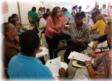
Capacitación de Lengua en PUCMM Santiago. 23 de noviembre, 2013.