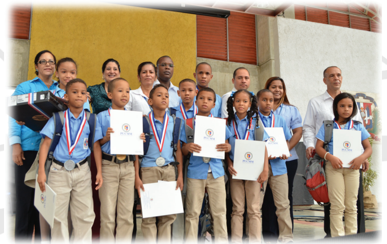
Estudiantes ganadores de 3ero. y 4to. Grados.