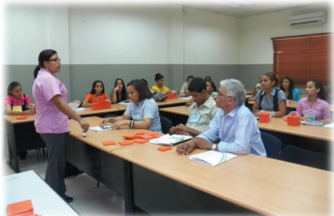
Capacitación de Matemática a los estudiantes del ISFODOSU, Santiago. 25 de noviembre, 2013.