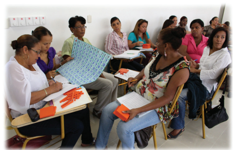
Capacitación de Matemática en la PUCMM, Santiago, 18 de octubre, 2013.