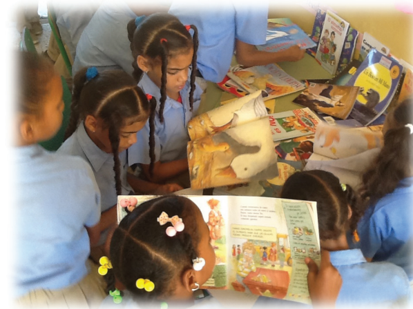
Estudiantes disfrutan de la lectura de los libros de cuentos.