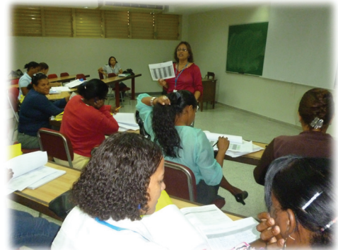
Formación de Matemática a coordinadores. 11 de septiembre, 2013.